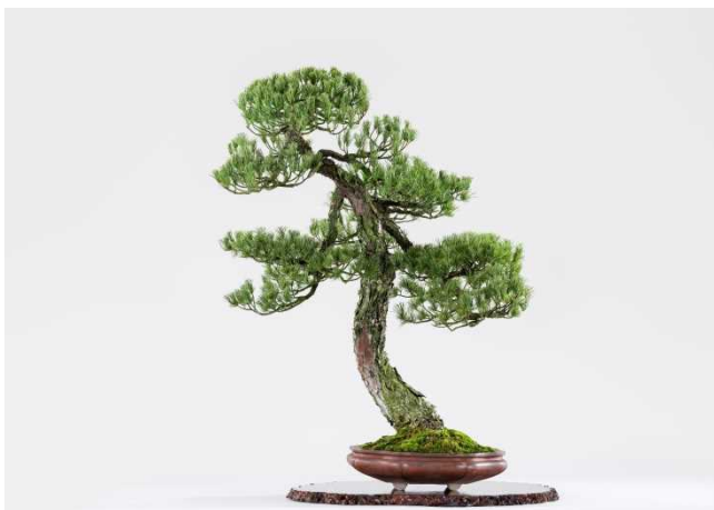
五葉松 銘 輪の舞