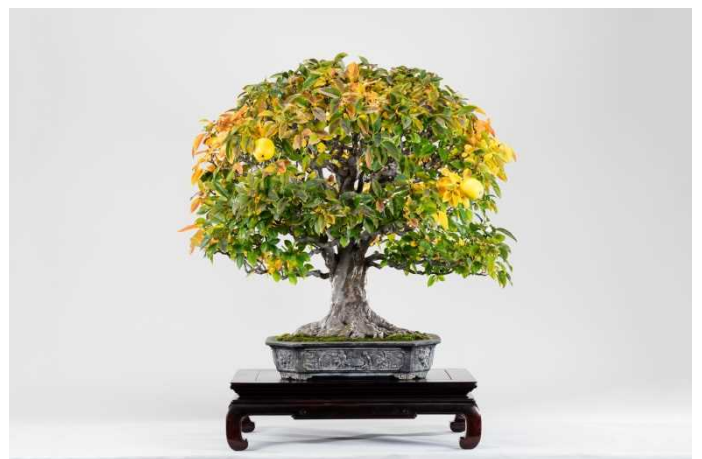
さいたま市大宮盆栽美術館所蔵 花梨